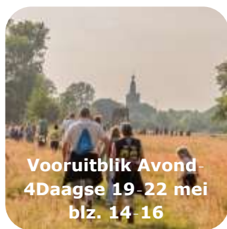
Vooruitblik Avond- 4Daagse 19-22 mei blz. 14-16