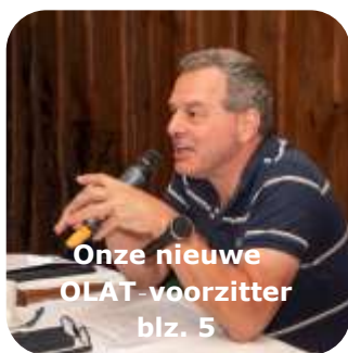
Onze nieuwe OLAT-voorzitter blz. 5