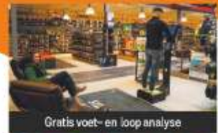
Gratis voet- en loopanalyse