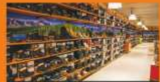
Compleet assortiment premium merken

* Niet in combinatie met spaarsysteem en acties