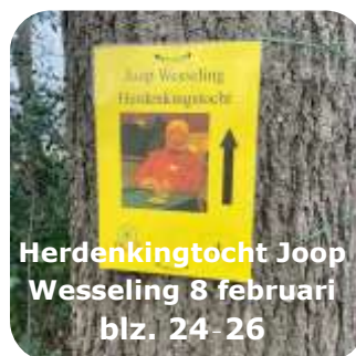
Herdenkingtocht Joop Wesseling 8 februari blz. 24-26